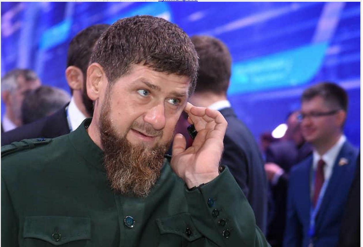
Глава Чечни Рамзан Кадыров

Фото: Коммерсантъ / Дмитрий Азаров купить фото