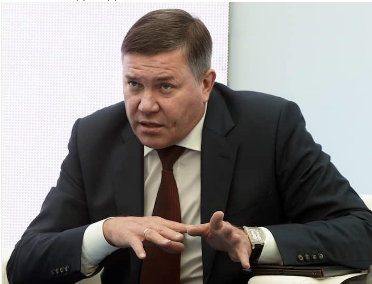
Губернатор Вологодской области Олег Кувшинников