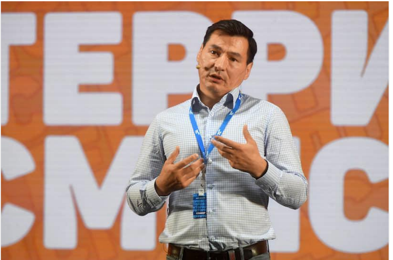
Глава Калмыкии Бату Хасиков