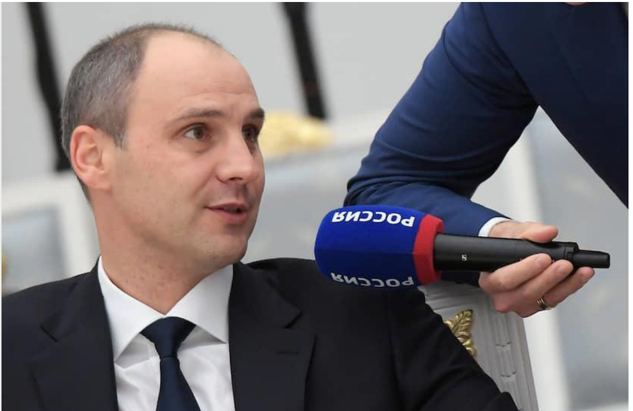
Губернатор Оренбургской области Денис Паслер

Фото: Коммерсантъ / Дмитрий Азаров купить фото