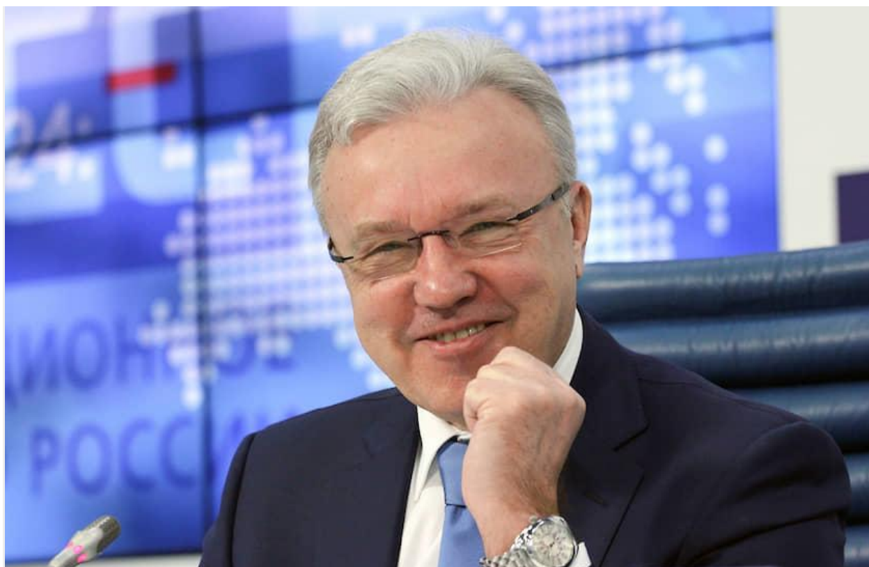
Губернатор Красноярского края Александр Усс