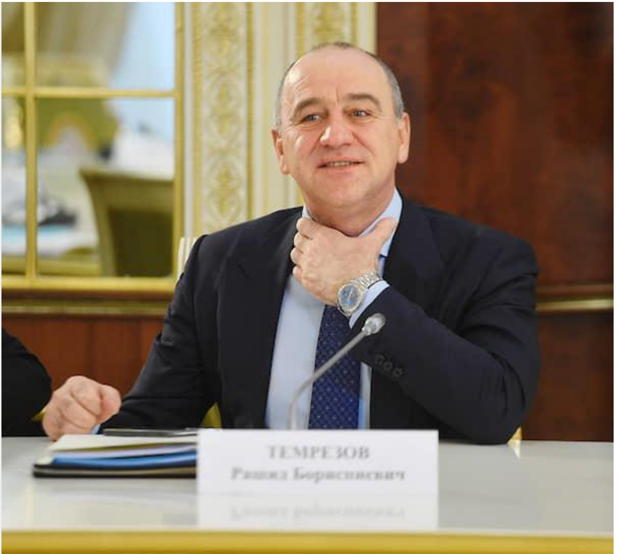
Глава Карачаево-Черкесии Рашид Темрезов