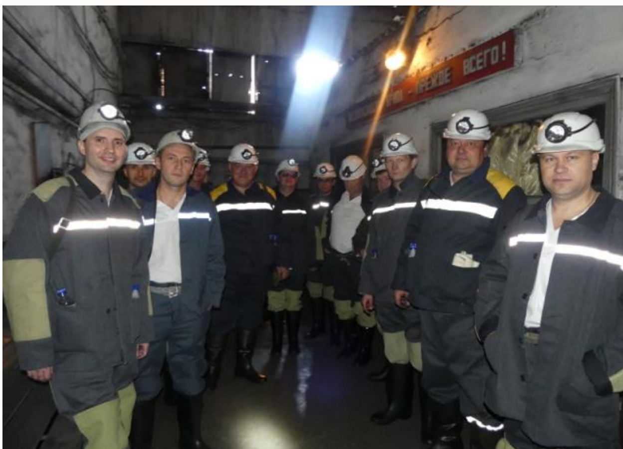
Шахтёры ДНР

Судьбоносным можно считать решение президента РФ Владимира Путина о введении упрощенной процедуры получения российского гражданства для жителей Донбасса. На сегодняшний день российские паспорта уже получили 227 тысяч жителей ЛДНР. Процесс постепенно вышел на достаточно приемлемый уровень — с такими темпами понадобится еще 4–5 лет, и республики будут преимущественно населены не просто русскими, а российскими гражданами.