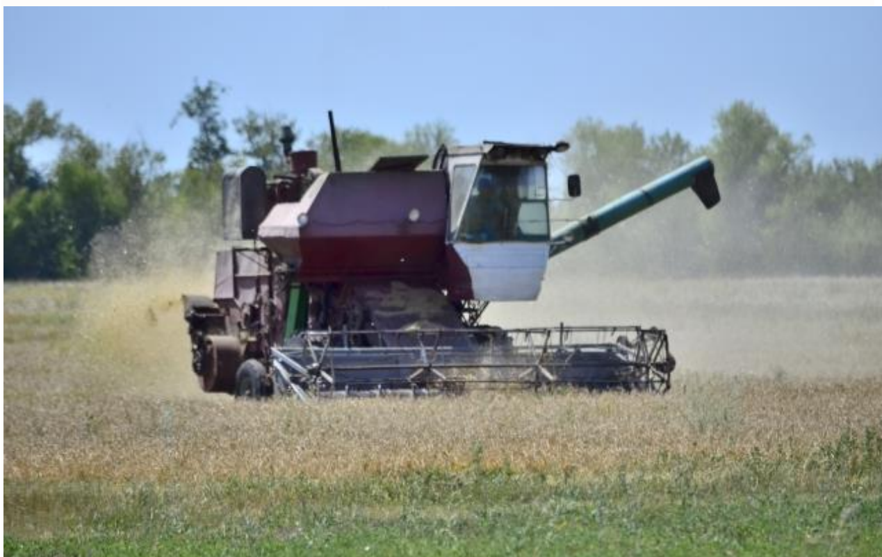
Сельское хозяйство ДНР

устройства и бюджетного процесса в ДНР». До 16 января все экономические, и в том числе бюджетные, показатели республики считались гостайной. Теперь в Донецке обещают публиковать бюджет (кстати, в 2020 году он в республике впервые годовой, а не поквартальный).